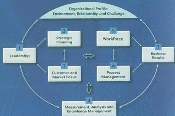
Baldrige Criteria Framework: A Systems Perspective

MBCFPE mencakup seluruh aspek organisasi yang secara sistematis dirumuskan dalam 7 kategori seperti pada bagan :